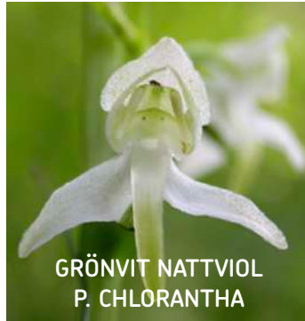
GRÖNVIT NATTVIOL P. CHLORANTHA