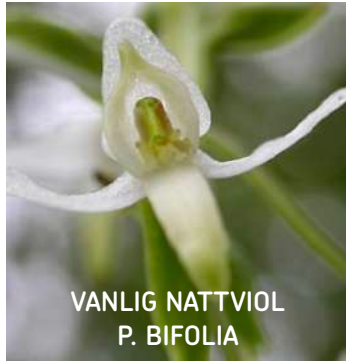
VANLIG NATTVIOL P. BIFOLIA